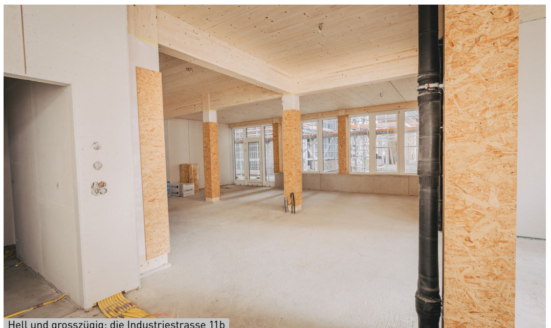
Hell und grosszügig: die Industriestrasse 11b