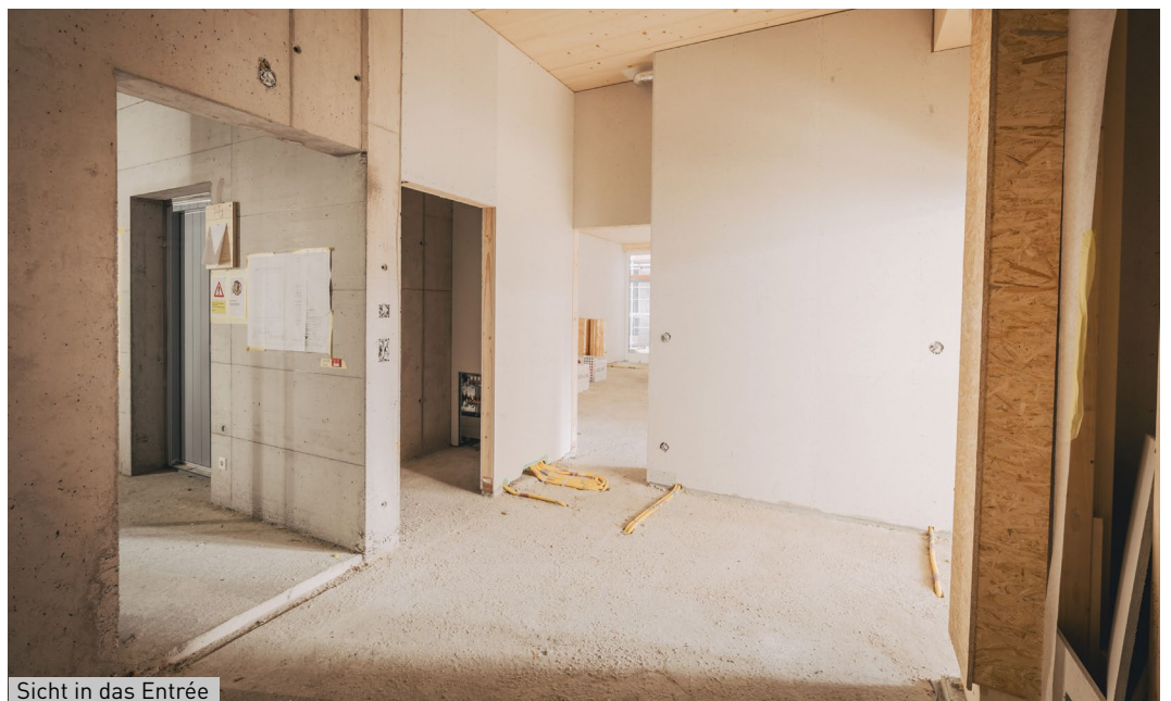
Sicht in das Entrée