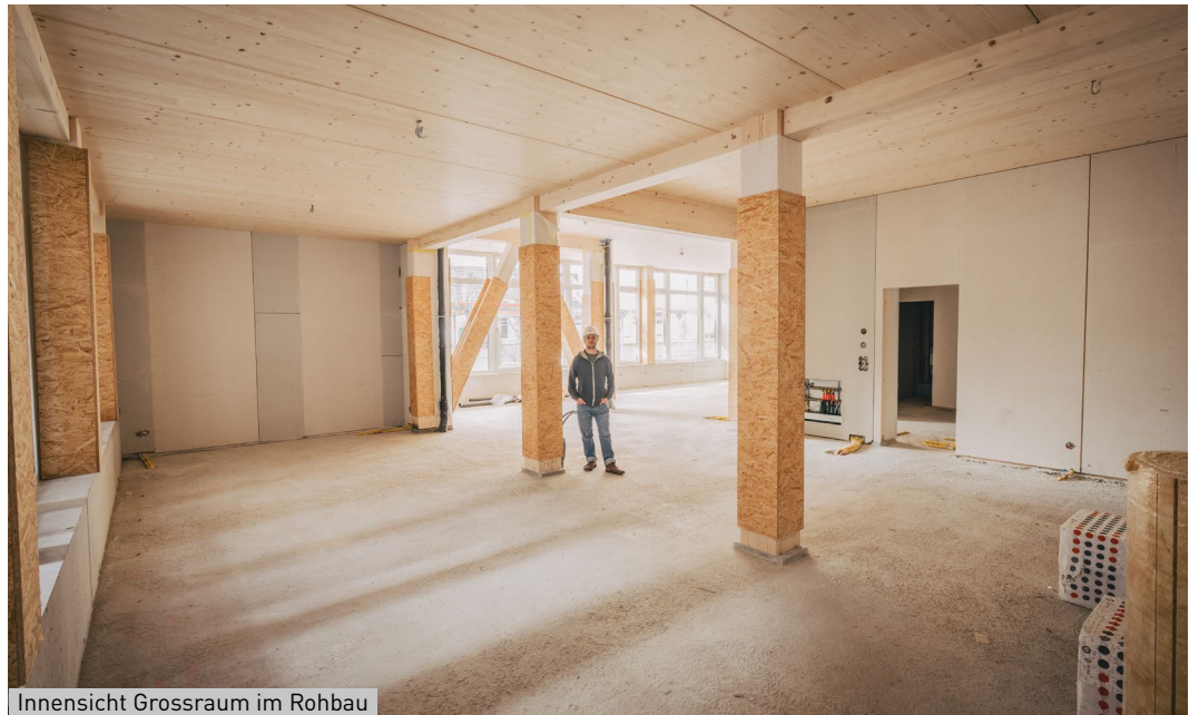
Innensicht Grossraum im Rohbau